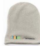
Haube Osteiermark Modelinie Oststeiermark | € 14.-