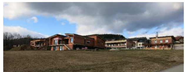
Pfarrhofgründe St. Lorenzen a. W.

Über weitere Baulandausweisungen in Lorenzen laufen derzeit Gespräche mit der Liegenschaftsverwaltung des Bischöflichen