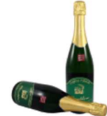
Hirschbirn Sekt Bauernladen Pöllau | € 11,90