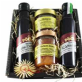
Pöllauer Geschenkspackerl Naturparkbauernhof Pöttl | € 28