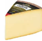
Almenland Stollenkäse Erz. Johann Kaufhaus Reisinger | € 16,50