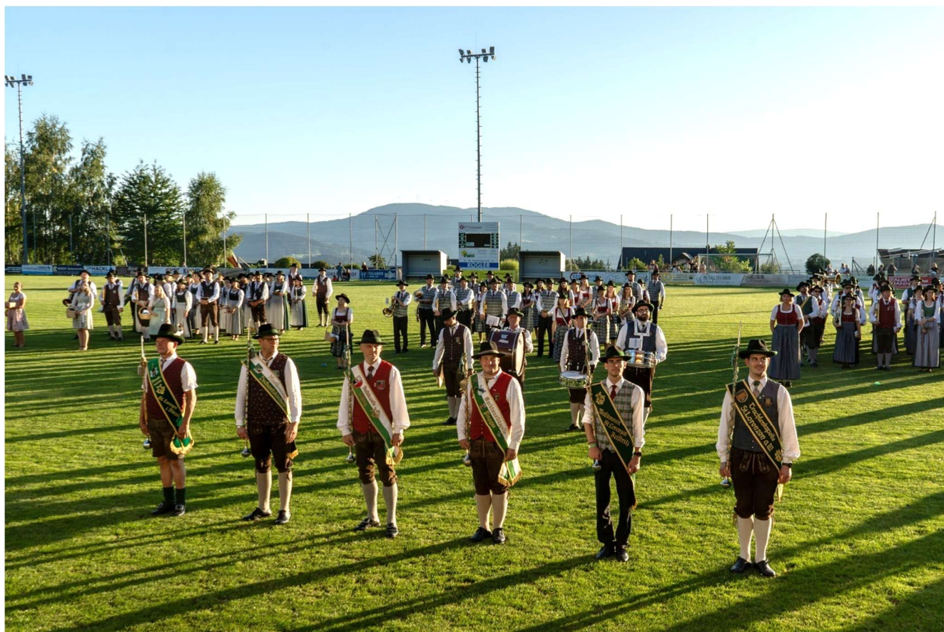
Am 20./21. September feierte die Trachtenkapelle St. Lorenzen am Wechsel ihr 150-Jahr-Jubiläum